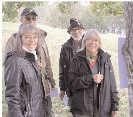
En tipspromenad med frågor om Kilsbergen och Tomasboda med en del kluriga frågor väntade deltagarna. Priser med bl.a mat-checkar till de bästa.