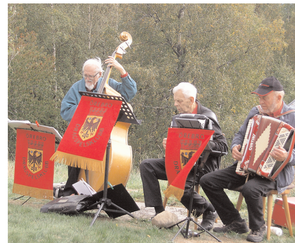
En trio från Örebro Dragspelklubb underhöll med glada låtar.