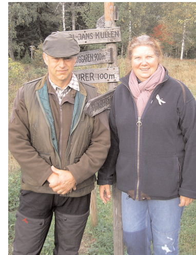
Långväga gäster till föreningens 90-årsfirande kom ända från Skåne.

Baka egna Skrabbelucker 1 ägg 3/4 kkp socker 2 kkp mjöl 1,5 tsk bakpulver 1 kkp mjölk smör till gräddning (ett gammalt recept efter Kajsa Warg)