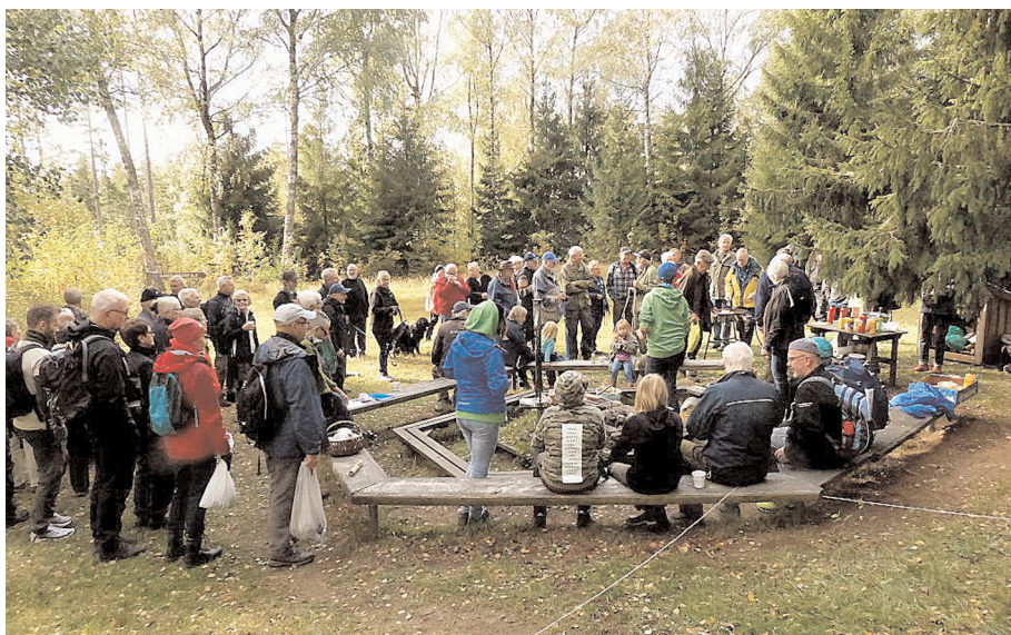
Vid grillplatsen bjöds det på korv med bröd och nygrillade skrabbelucker.

1928 bildades Föreningen Kilsbergstugan, och 23 september i år firades 90-årsjubileet i Tomasboda inför en talrik publik. Över 120 personer hade samlats, och NSF Scouterna bjöd på såväl grillad korv som skrabbeluckerbakning över öppen eld. Det senare är en kombination av sockerkaka och pannkaka som efter gräddning vänds i kanelsocker och smakar alldeles utmärkt till en rykande kopp kaffe. Såväl kaffe som kaffebröd hade en rykande åtgång den här jubileumsdagen, till slut var det endast knäckebröd som kunde erbjudas som tilltugg till kaffet.