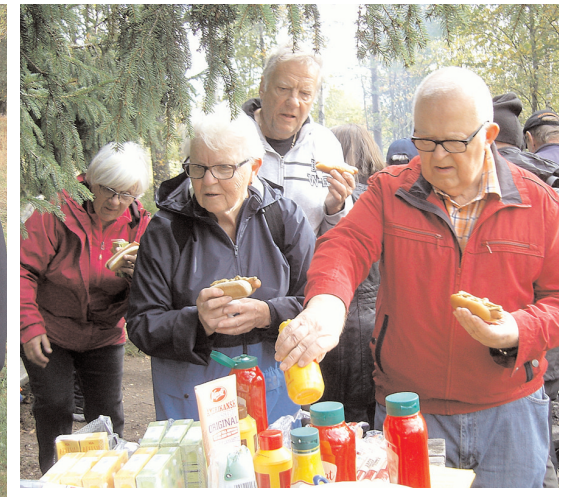
Vid grillplatsen bjöds det på korv med bröd och skrabbelucker.