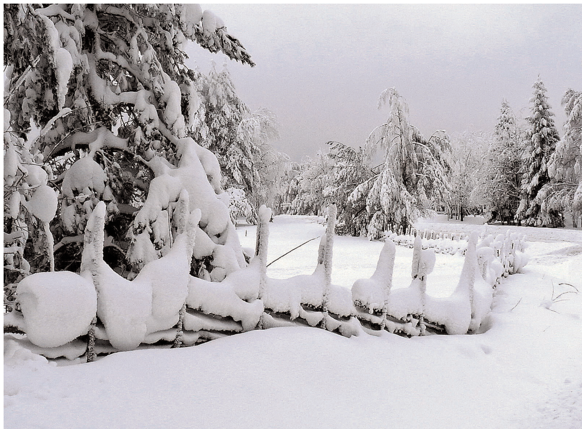
Vinterlandskap i Tomasboda . Den här fina bilden tog Kjell Stockhaus vintern 2018.

Vi fick uppleva en av de snörrikaste vintrarna på många år i Kilsbergen, och aktiviteterna vid Kilsbergsstugan i Tomasboda har varit rekordstor. Varje helg som scouterna haft serveringen öppen har besökarna fyllt platserna runt borden i stugan. Spårsystemen i Kilsbergen är täta och efterfrågan på spärkartor har därför också varit stor.