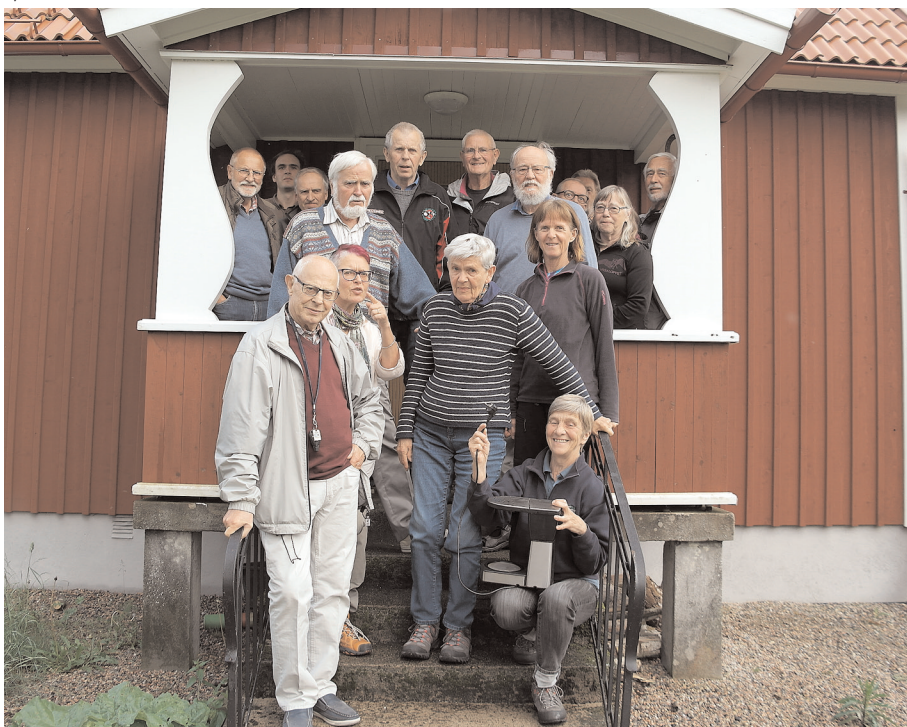
Ingen ström till kaffebryggaren. Huset verkade helt utan ström, men det hela redde ut sig.