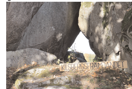
En riktig skröna. Det var vid Ulvgryt som jätten Rises kastade sina stenar.

Skomakaren kliade sig i huvudet och sa, att på sin vandring från Örebro hade han slitit ut alla dessa skor som han hällde ut över vägen. Då blev jätten missmodig, släppte sina stenblock och vände hem till Kilsbergen igen.