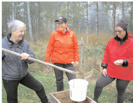
Glada miner. Den här trion konstaterade att det fanns vatten i brunnen.

Nu får vi hoppas att hösten och vintern blir nederbördsrik så att grundvattnet återgår till normala värden.