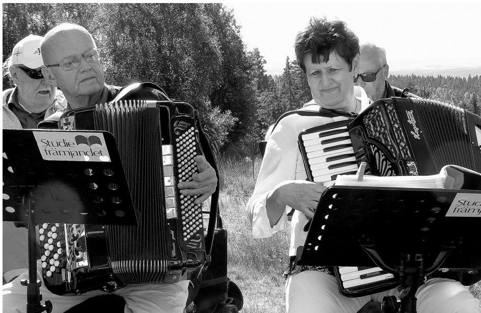
Dragspelmusik och sommar. Kumla Musiksällskap bjöd på många klämmiga låtar.

Tomasbodadagen firades en av de sista dagarna i augusti i strålande sensommarsol. Det var en tämligen vältalig publik som hade samlats framför den soliga södra gaveln av Kilsbergsstugan för att njuta av musiker från Kumla Musiksällskap.