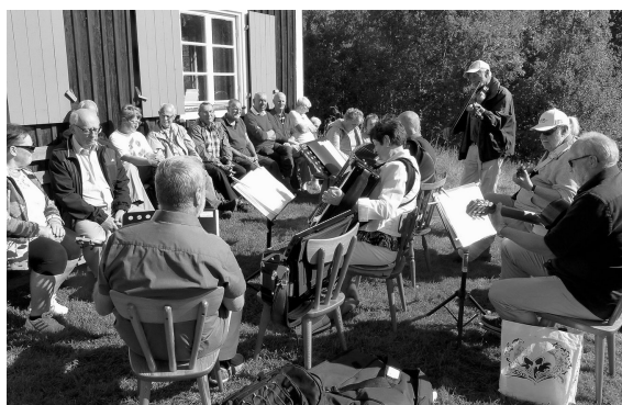
Soliga södra gaveln. Besökarna vid Tomasbodadagen kunde njuta av en härlig sensommardag.